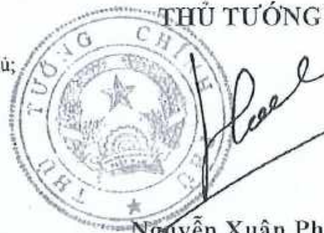
THỦ TƯỚNG Nguyễn Xuân Phúc 4